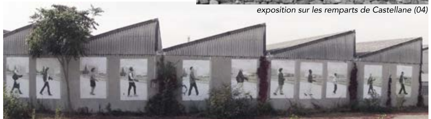
exposition sur les mur d'une Usine à Vaux-en-Velin (69)