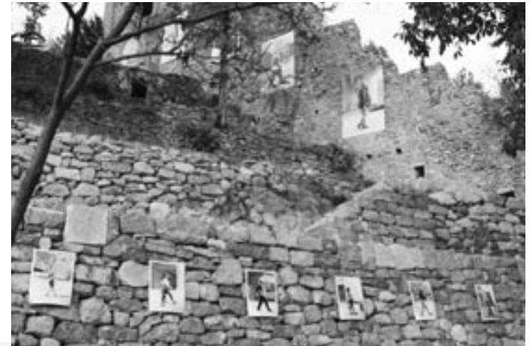
exposition sur les remparts de Castellane (04)