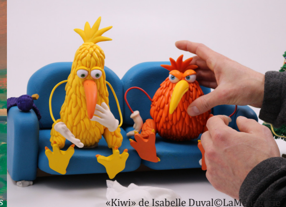
«Kiwi» de Isabelle Duval©LaM