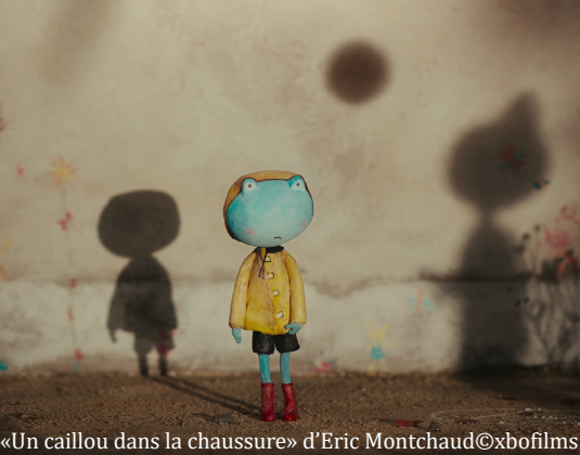
«Un caillou dans la chaussure» d'Eric Montchaud