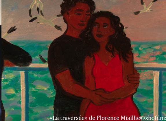
«La traversée» de Florence Miailhe