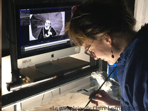
«Le parapluie» de Claire Ledru